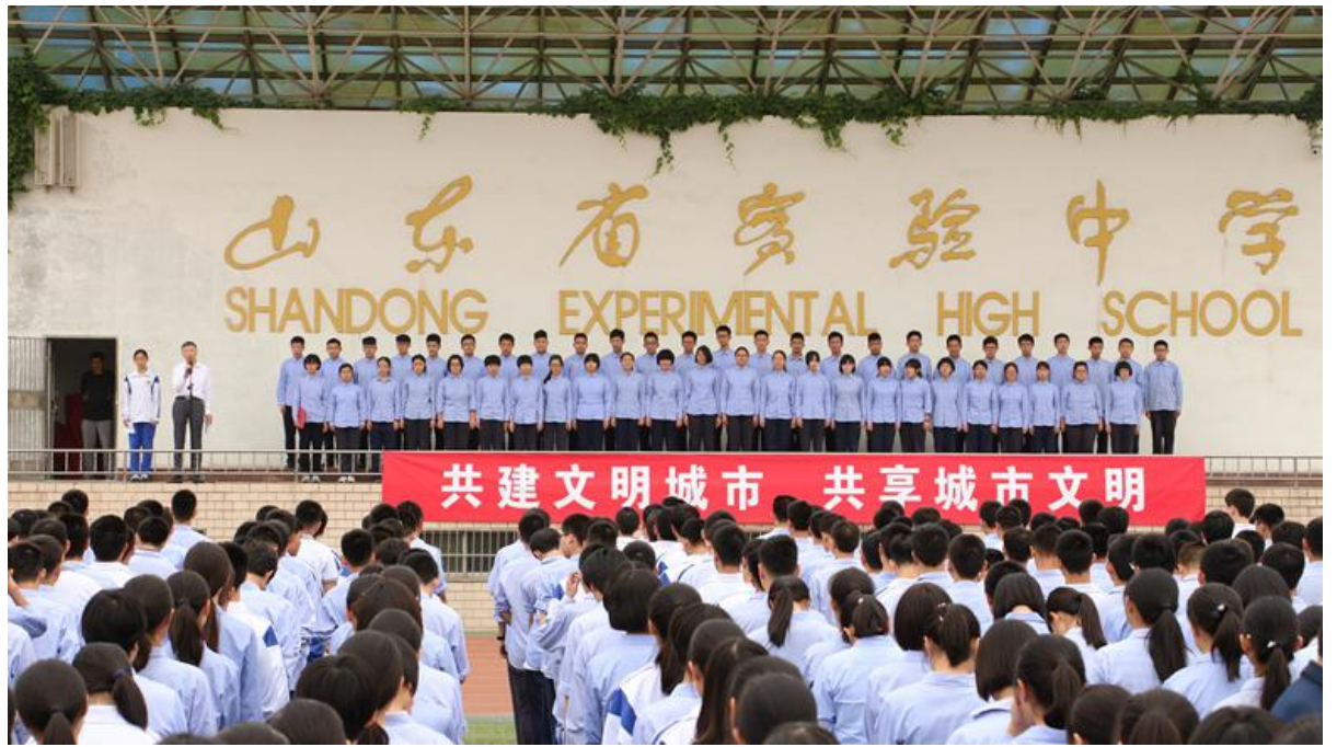
创建文明城市、文明校园主题教育活动