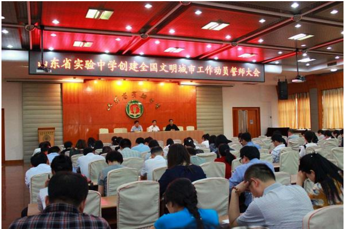
创建全国文明城市、文明校园动员誓师大会